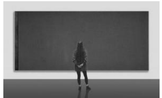
Wie is bang voor rood, geel of blauw? (Barnett Newman; schilderij Stedelijk Museum)

Hoe reageren wij als er een ander, een vreemde, bij ons binnenwandelt of onze buurvrouw wordt?