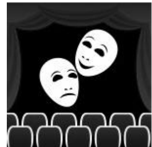
Wie is bang voor Virginia Woolf? (toneelstuk Edward Albee).

In zowel schilderij als toneelstuk/film worden wij uitgedaagd om onze eigenaardigheden onder ogen te zien als het gaat over anders en vreemd.