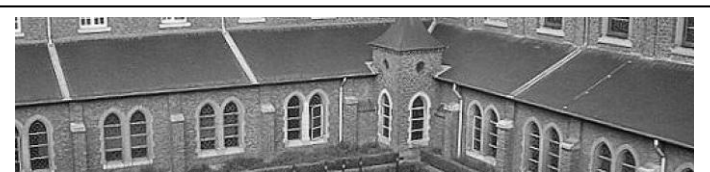
Klooster Liibosch in Echt. Douwe 'zijn' klooster.