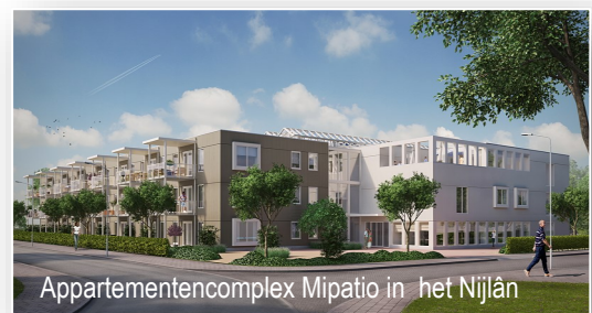
Appartementencomplex Mipatio in het Nijlân